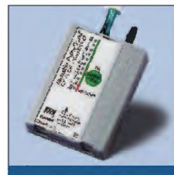
Beide Geräte können mit dem EX 3000 Pulse Dose Sauerstoff-Demandsystem genutzt werden