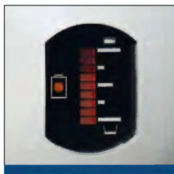
LED-Anzeige für Batterie und Füllstand